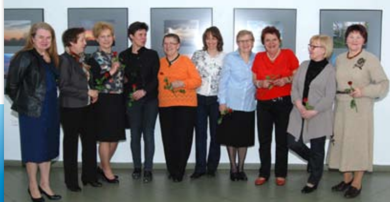
Autorki prac podczas wernisażu