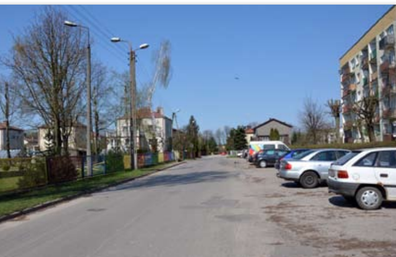
Na dniach ruszą prace na ul. Wita Stwosza