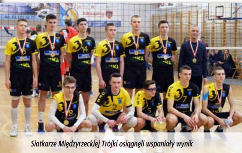
Siatkarze Międzyrzeckiej Trójki osiągnęli wspaniały wynik