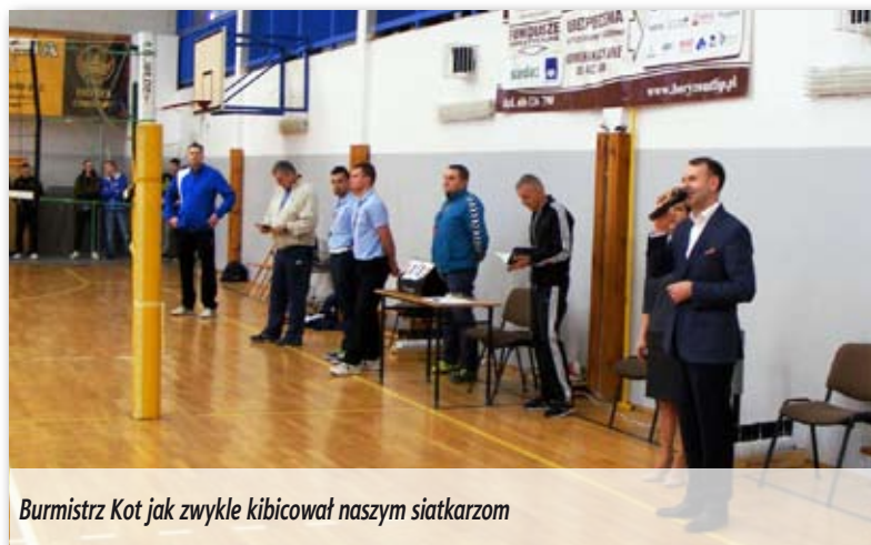
Burmistrz Kot jak zwykle kibicował naszym siatkarzom