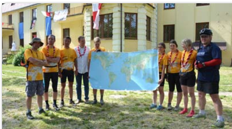
Ekipa pierwszego etapu sztafety zatrzymała się w Międzyrzecu Podlaskim