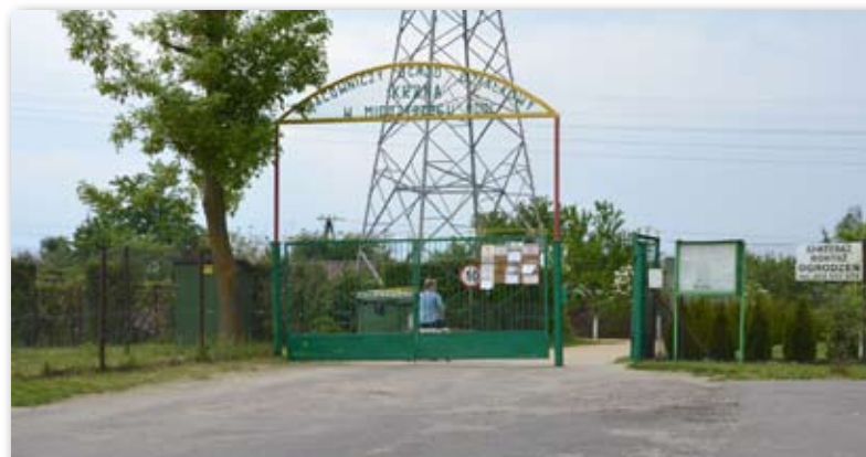
Na terenie „Krzna” niebawem zostanie zamontowany monitoring

Dotacja mogła być udzielona w wysokości 70 proc. poniesionych nakładów, w kwocie nie wyższej niż 10 000 zł.