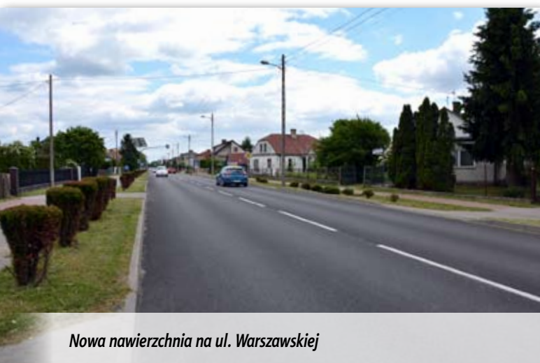
Nowa nawierzchnia na ul. Warszawskiej