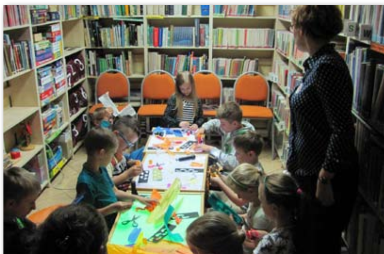
Dzieciom podobało się wieczorne myśkowanie po bibliotece

o Afryce i jej mieszkańcach. Na zakończenie spotkania dzieci wykonały podróżnicze zakładki – witraże.