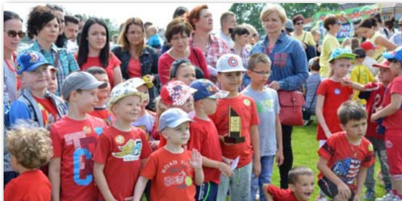
W olimpiadzie wzięło udział 366 przedszkolaków