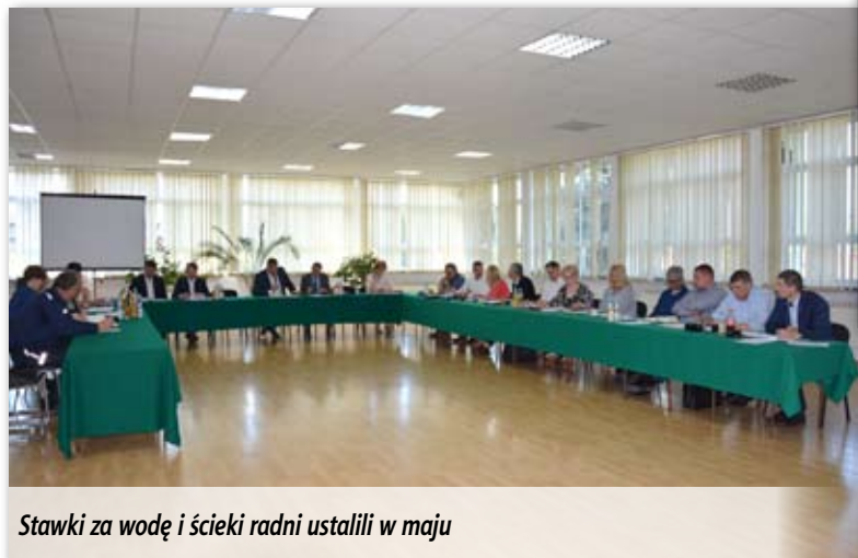
Stawki za wodę i ścieki radni ustalili w maju

zł (spadek o 44 gr). Odbiorcy wody i ścieków zaoszczędzą też na opłacie abonamentowej. Stawka w miesięcznym rozliczeniu to 10,79 (zmalą 45 gr), natomiast w dwumiesięcznym wynosi 11,03 zł (spadek o 44 gr). Nowe taryfy będą obowiązywać od 30 czerwca 2017 r.