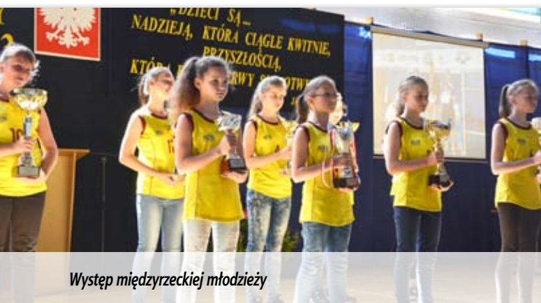
Występ międzyrzeckiej młodzieży