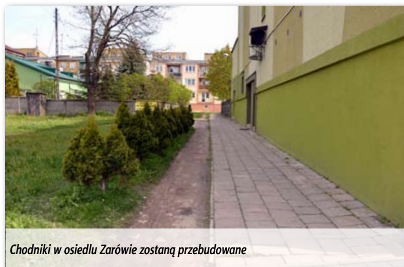
Chodniki w osiedlu Zarówie zostaną przebudowane