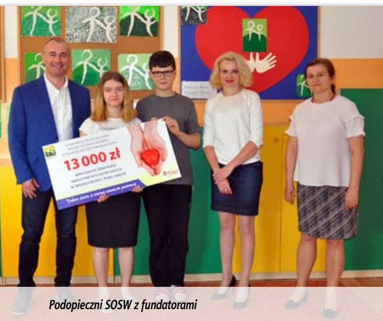
Podopieczni SOSW z fundatorami

W dowód wdzięczności za ten hojny dar podopieczni międzyrzeckiego SOSW wykonali prace plastyczne ilustrujące logo Fundacji, które trafią na organizowane przez nią aukcje charytatywne.