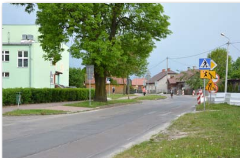
Dzięki inwestycji dzieci będą mogły poruszać się bezpiecznie

Projekt pn. „Poprawa warunków bezpieczeństwa w obrębie przejścia dla pieszych w ul. Leśnej w Międzyrzec Podlaskim” warty jest 50 000 zł. W ramach zadania przy Zespole Placówek Oświatowych nr 3 zainstalowany zostanie aktywny znak ostrzegawczy, pojawi się także nowa „zebra”, wykonana ze specjalnej masy.