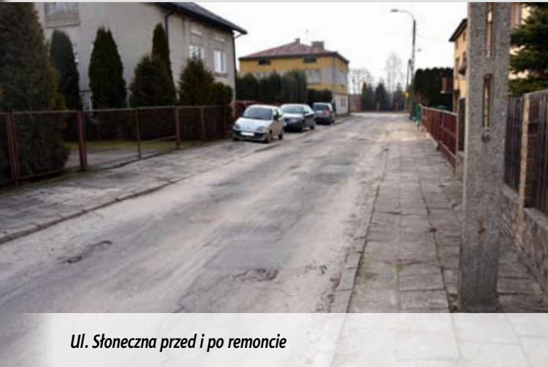
Ul. Słoneczna przed i po remoncie

Pełną parą idą też prace na ul. Wita Stwosza. Wykonano już podbudowę ulicy, a obecnie na ukończeniu jest przebudowa zatoki parkingowej. Zakończył się remont ul. Słonecznej i budowa ul. Lipowej, a nowa nawierzchnia pojawiła się na ul. Warszawskiej (od skrzyżowania z ul. 3 maja i Przechodniej). Miasto rozstrzygnęło też przetarg na przebudowę chodników w osiedlu Warszawska (etap II). Remonty rozpoczną się na początku lipca, a ich koszt wyniesie blisko 211 000 zł. Również chodniki znajdujące się w osiedlu Zarówie zostaną przebudowane. Prace będą kosztowały prawie 178 000 zł.