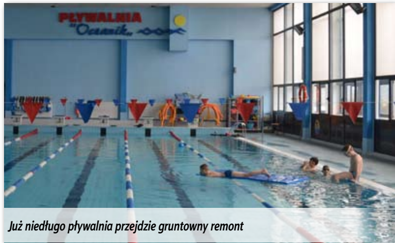
Już niedługo pływalnia przejdzie gruntowny remont

zegarkiem, co w znacznym stopniu ułatwi korzystanie z szatni szczególnie osobom niepełnosprawnym. Koszt inwestycji to blisko 842 000 zł, z czego 342 000 miasto otrzyma z Ministerstwa Sportu i Turystyki w ramach Programu Modernizacji Infrastruktury Sportowej.