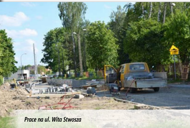
Prace na ul. Wita Stwosza