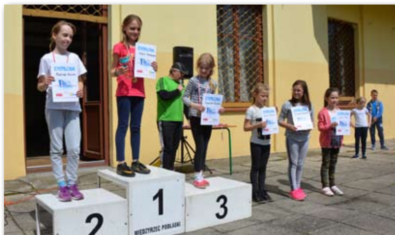
Na podium stanęli najszybsi