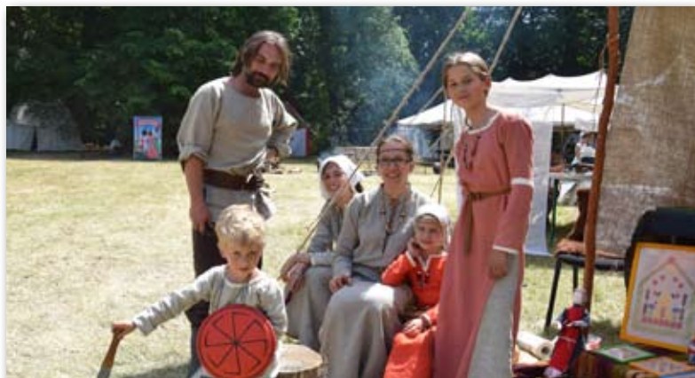
Odtwórcy przyjechali całymi rodzinami