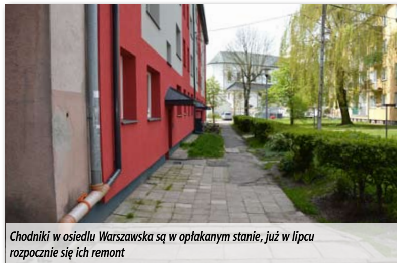
Chodniki w osiedlu Warszawska są w opłakanym stanie, już w lipcu rozpocznie się ich remont