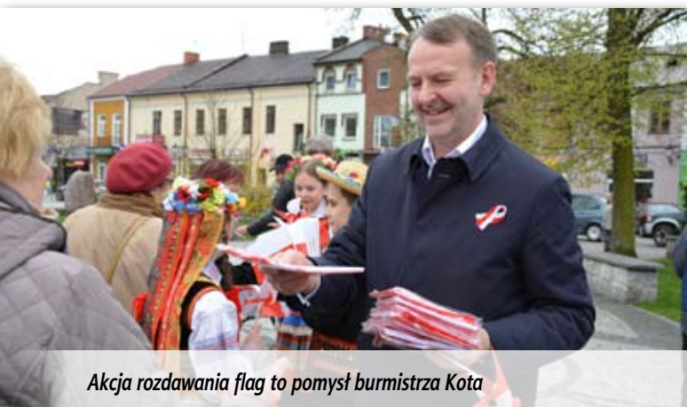
Akcja rozdawania flag to pomysł burmistrza Kota