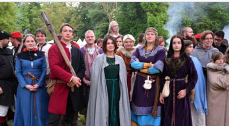
Wiaty to impreza, dzięki której możemy poczuć średniowieczny klimat