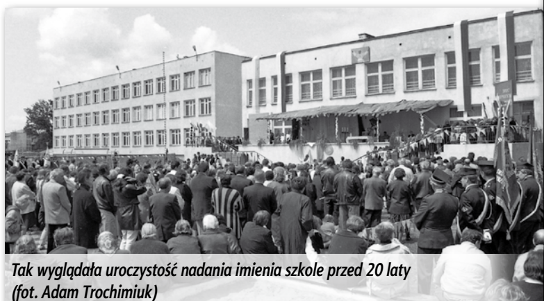
Tak wyglądała uroczystość nadania imienia szkole przed 20 laty