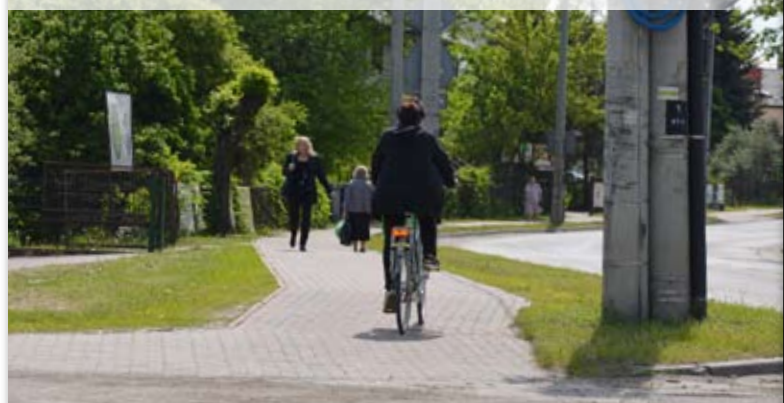
Jazda po chodnikach dozwolona jest tylko w wyjątkowych sytuacjach

Strażnicy przypominają, że korzystający z chodnika lub drogi dla pieszych są zobowiązani jechać powoli i ustępować miejsca pieszym. Zgodnie z przepisami kierujący jednośladem nie może przejeżdżać po przejściu dla pieszych, powinien zejść z roweru i przeprowadzić go po pasach. Straż Miejska rozpoczęła patrole rowerowe i póki co, poucza niesfornych rowerzystów.