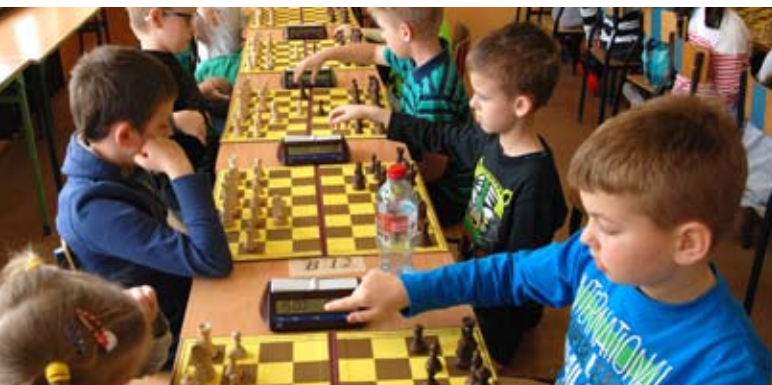
Młodzi mieli szansę wykazać się swoimi umiejętnościami

Zwycięzcy poszczególnych klasyfikacji zostali wyróżnieni pucharami, dyplomami oraz nagrodami finansowymi i rzeczowymi. Wszyscy uczestnicy turnieju do lat 10 otrzymali pamiątkowe dyplomy i upominki.