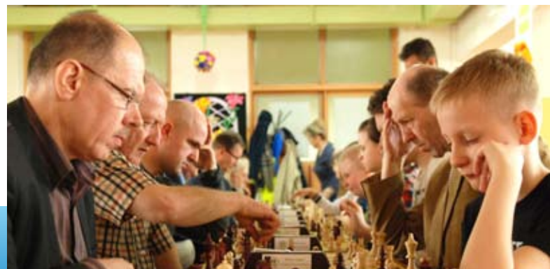
Do rywalizacji przystąpiły także osoby z różnych pokoleń, co dodawało charakteru całej imprezie