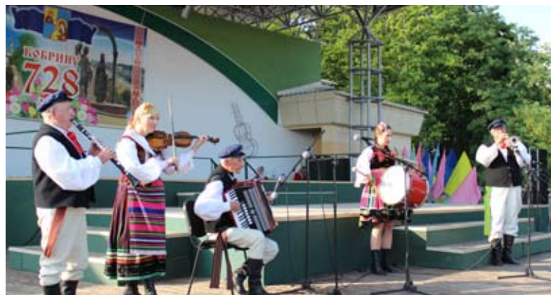
Międzyrzeckiemu zespołowi jak zwykle podczas występów towarzyszyła kapela

50-tysięczny Kobryń jest jednym z miast partnerskich Międzyrzecza Podlaskiego. Uczestnicy wyjazdu mieli okazję go poznać, a także zapoznać się z kulturą i historią, kiedyś przecież polskiego miasta.