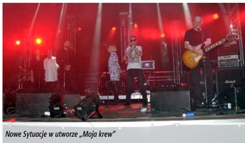
Nowe Sytuacje w utworze „Moja krew”