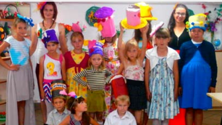
Najmłodsi podopieczni MOPS nie nudzili się w te wakacje

Podopieczni świetlicy socjoterapeutycznej „Strefa Serca” w Międzyrzeczu Podlaskim, nie nudzili się w te wakacje. W okresie od 29 czerwca do 31 lipca 2015r. uczestniczyli w zajęciach wakacyjnych zorganizowanych specjalnie dla dzieci z rodzin korzystających ze wsparcia Miejskiego Ośrodka Pomocy Społecznej. Wychowawcy świetlicy organizowali atrakcje dla 25 wychowanków, które trwały przez 5 dni w tygodniu. Czas ten upłynął dzieciom na grach i zabawach ruchowych na świeżym powietrzu, zajęciach edukacyjnych i rekreacyjnych. Podsumowaniem każdego dnia zajęć był obiad. Zajęcia zostały sfinansowane z dotacji budżetu miasta przyznanej Stowarzyszeniu Rodzicielstwa Zastępczego „Jedno Serce” w ramach zlecenia realizacji zadania samorządu szczebla podstawowego.