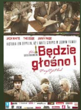
13.09 – godz. 19:00 „BĘDZIE GŁOŚNO” reż. Davis Guggenheim