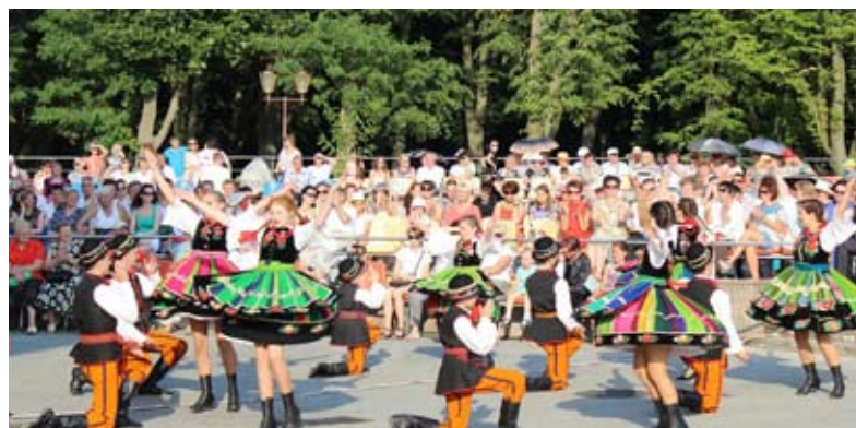
„Dzieci Podlasia” podbiły serca publiczności