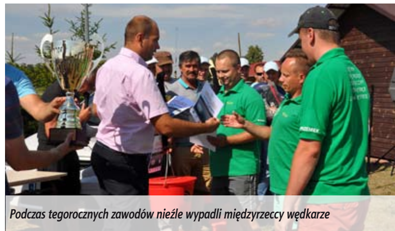
Podczas tegorocznych zawodów nieźle wypadli międzyrzeccy wędkarze

Do Międzyrzecza rok rocznie przyjeżdżają wędkarze z całej Polski