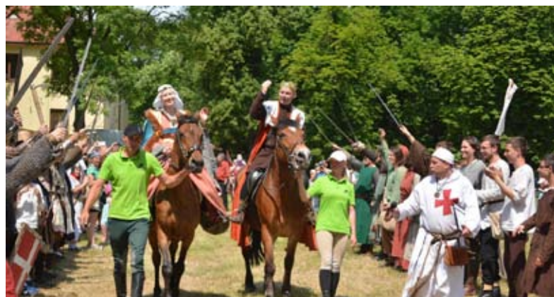
Powitanie króla to stały element imprezy