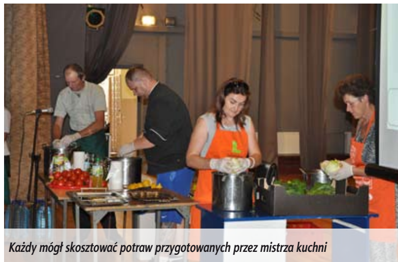
Każdy mógł skosztować potraw przygotowanych przez mistrza kuchni