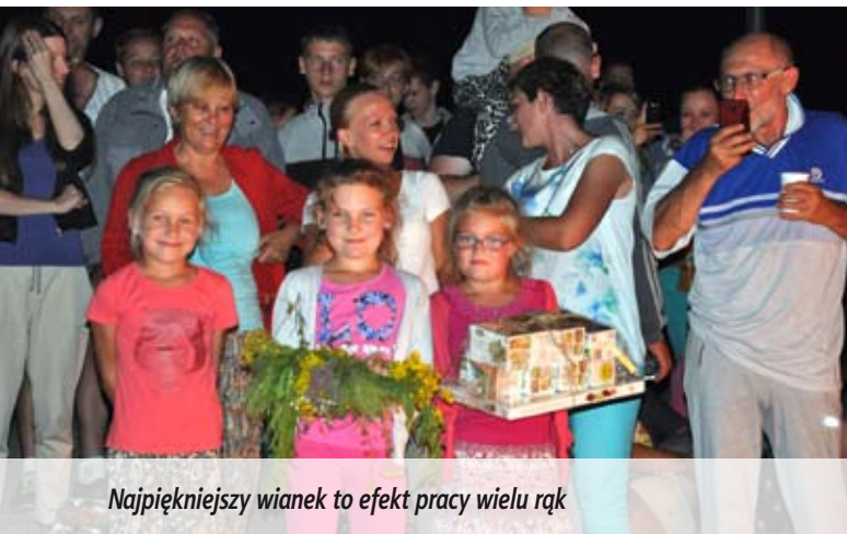
Najpiękniejszy wianek to efekt pracy wielu rąk

Tak jak dawniej, na plaży przy ul. Zahajkowskiej zapłonęło ognisko, a gości powi-