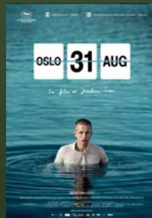
12.09 – godz. 19:00 „OSLO, 31 SIERPNIA” reż. Joachim Trier