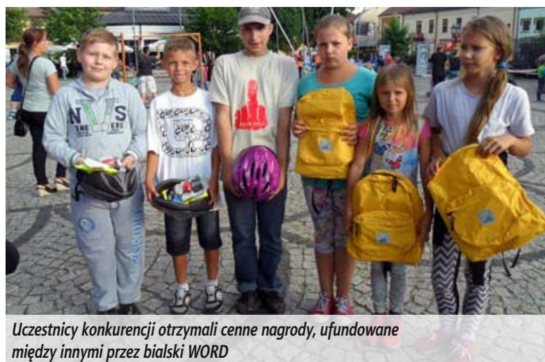
Uczestnicy konkurencji otrzymali cenne nagrody, ufundowane między innymi przez białski WORD

Organizatorzy dziękują sponsorom, bez wsparcia których nie udałoby się zapewnić aż tylu atrakcji.