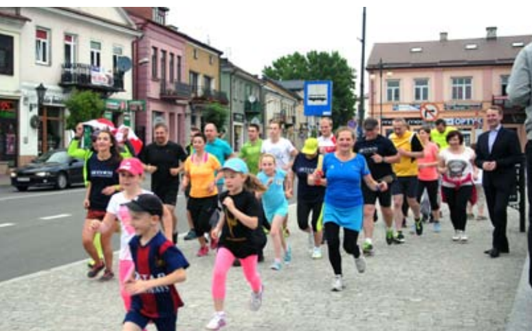
Gotowi do biegu, start!