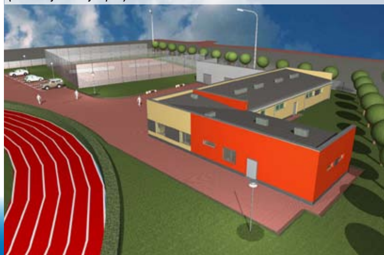
Tak w przyszłym roku będzie wyglądać zaplecze międzyrzeczeckiego stadionu (wizualizacja Andrzej Filipiuk)

Miasto podpisało umowę z Ministerstwem Sportu i Turystyki na dofinansowanie rozbudowy zaplecza stadionu Miejskiego Ośrodka Sportu i Rekreacji. Prace budowlane rozpoczną się jesienią tego roku. Inwestycja będzie kosztowała niespełna 1,3 mln zł, z czego połowę zapłaci ministerstwo. Samorząd otrzyma fundusze w dwóch ratach. Istniejący budynek zostanie wyburzony, a w jego miejsce powstanie nowy, dwukrotnie większy. Znajdą się w nim cztery przestronne szatnie połączone z zapleczem sanitarno- higienicznym dla sportowców, pomieszczenie dla trenerów i sędziów, magazyny, a także sanitariaty dla kibiców. Obecnie trwa przygotowanie do przetargu, który wyłoni wykonawcę. Przebudowa ma zakończyć się przed rozpoczęciem rozgrywek piłkarskich w sezonie 2016/2017.