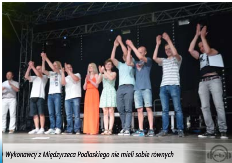
Wykonawcy z Międzyrzecza Podlaskiego nie mieli sobie równych