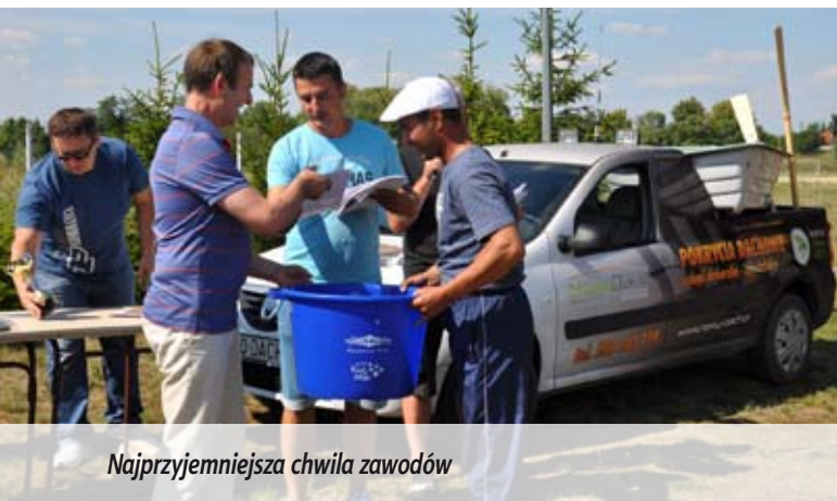
Najprzyjemniejsza chwila zawodów