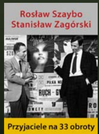
27.09 – godz. 19:00 „PRZYJACIELE NA 33 OBROTY” reż. Grzegorz Brzozowicz