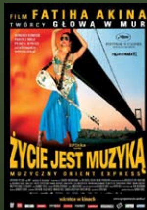
6.09 – godz. 19:00 „ŻYCIE JEST MUZYKĄ” reż. Fatih Akin