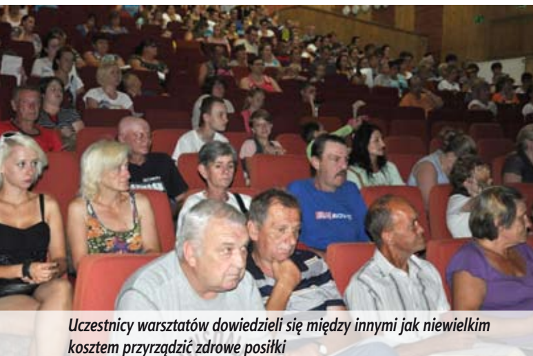
Uczestnicy warsztatów dowiedzieli się między innymi jak niewielkim kosztem przyrządzić zdrowe posiłki

Spotkanie odbyło się w ramach tzw. działań towarzyszących POPŻ – Podprogram 2015.