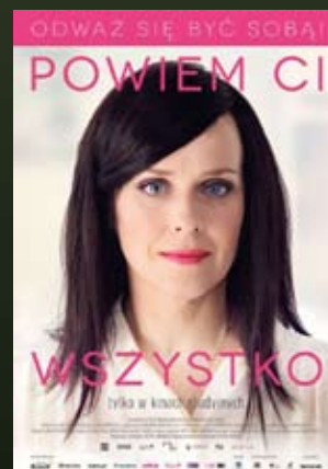
26.09 – godz. 19:00 „POWIEM CI WSZYSTKO” reż. Simo Halinen