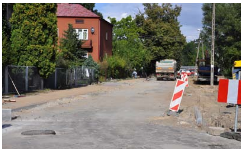
Ulica Parkowa niebawem zmieni się nie do poznania

Dobiega końca remont ulicy Ceglanej. Na odcinku 460 metrów pojawi się nowa nawierzchnia bitumiczna. W ramach inwestycji wymieniono także krawężniki. Wcześniej zakończyły się prace na ul. Adamki, gdzie na odcinku 220 metrów wybudowana została kanalizacja deszczowa, z wylotem do kanału Wieprz-Krzna i osadnikiem zawieszin mineralnych. Całkowity koszt tej inwestycji to 177tys. zł. Mieszkańcy muszą uzbroić się w cierpliwość. Utrudnienia komunikacyjne są w rejonie przebudowywanej właśnie ul. Parkowej. Tu pojawi się nowa nawierzchnia asfaltowa, a także zatoka parkingowa z kostki brukowej przy bloku 10H. Prace zakończą się pod koniec września. Ich koszt zamknie się w kwocie 120 tys. zł. O wiele lepiej prezentują się też ulice: Kościuszki i Siteńska, gdzie łącznie na odcinku prawie 1,2 kilometra został położony asfalt. Zadanie zrealizowano w ramach umowy zawartej między Zarządem Dróg Powiatowych a wykonawcą, za wykorzystanie pasa drogowego w trakcie przebudowy linii kolejowej.