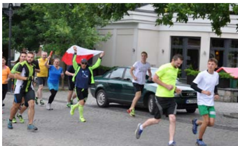
Wszyscy ci, którzy zdecydowali się wyjść z domu i poruszać się z innymi, stworzyli wyjątkową atmosferę

Za rok uczestników ma być więcej. Organizatorzy planują zaangażować do akcji np. szkoły czy zakłady pracy