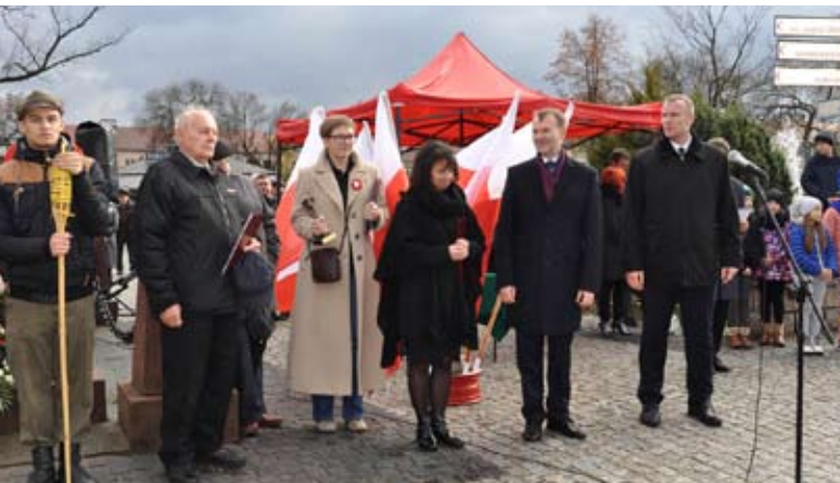
Uchonorowani odznaczeniami i nagrodami

Po mszy w intencji ojczyzny w kościele pw. św. Mikołaja uczestnicy w asyście Konnej Straży Ochrony Przyrody i Tradycji przemazzerowali pod pomnik Bohaterów Miasta, gdzie władze miasta, gminy i poszczególne delegacje złożyły kwiaty i zapaliły znicze.