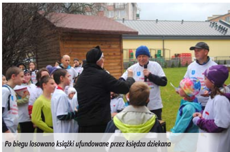
Po biegu losowano książki ufundowane przez księdza dziekana