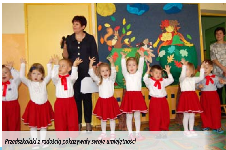
Przedszkolaki z radością pokazywały swoje umiejętności