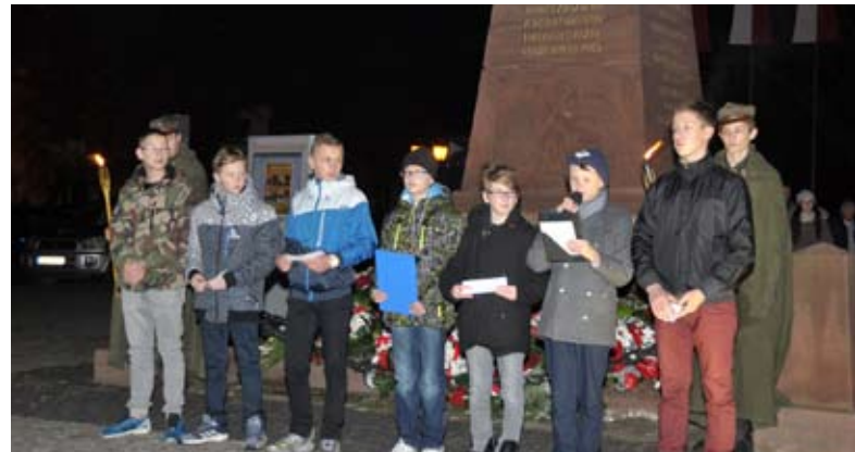
W tym roku międzyrzeczka młodzież po raz dwudziesty oddała hołd bohaterskim przodkom