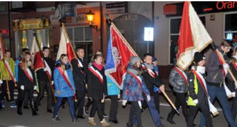
Młodzież co roku uczestniczy w marszu upamiętniającym dramatyczne wydarzenia w mieście

Wydarzenia w Międzyrzeczu potoczyły się pod prąd historii. Kiedy reszta kraju cieszyła się wolnością, na ulicach miasta lała się krew. 16 listopada 1918 roku Międzyrzec zaatakowali niemieccy „huzarzy śmierci”. Wyciągali ludzi z domów i zabijali na ulicach, a do mieszkań wrzucali przez okna granaty. Mieszkańcom odbierano broń, zabierano kosztowności, poszukiwano ukrywających się peowiaków. Ciała zabitych Niemcy wrzucali do zbiorowego dołu w parku. Dopiero trzy dni później odbył się uroczysty pogrzeb ofiar. W ciągu trzech dni zamieszek zginęły 52 osoby: wojskowi i cywile. W 97 rocznicę tych wydarzeń przy pałacu Potockich, w miejscu gdzie bronili się oddział POW, ustawiły się poczty sztandarowe szkół miejskich i gminnych. Po umieszczeniu na maszcie flagi państwowej i odśpiewaniu hymnu, kilkusetosobowa grupa młodzieży i mieszkańców miasta, w asyście Konnej Straży Ochrony Przyrody i Tradycji, z zapalonymi pochodniami przemarszerowała na plac Jana Pawła II. Tam, pod pomnikiem Bohaterów Miasta, odczytano