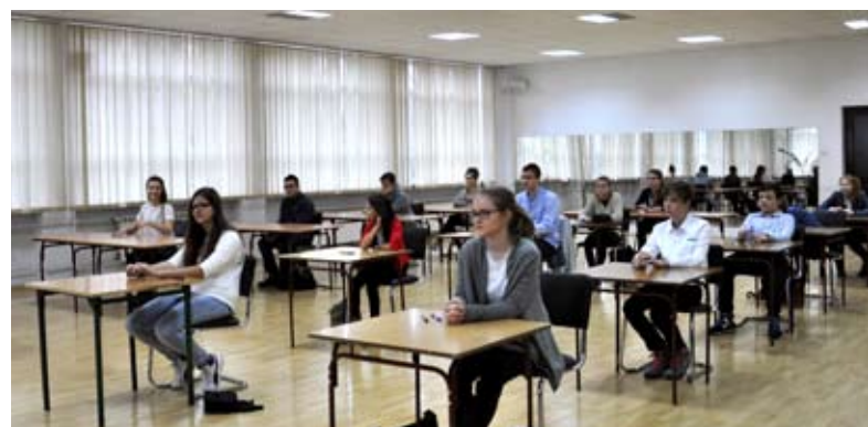
Do finału zakwalifikowali się zwycięzcy szkolnych eliminacji