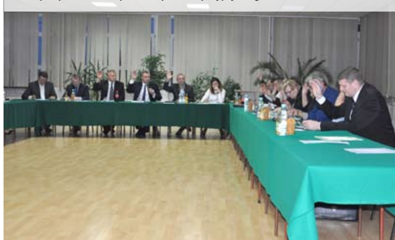
Uchwałę w sprawie stawek podatkowych radni podjęli jednogłośnie

Więcej informacji w Biuletynie Informacji Publicznej.