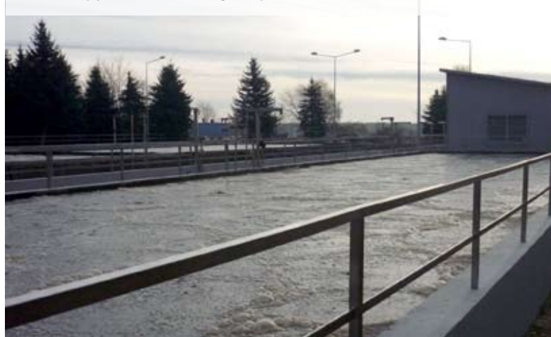
Dzięki inwestycji zmieniono technologię oczyszczania ścieków

Dzięki tej inwestycji oczyszczalnia może przyjąć większą ilość ścieków, a jakość ich oczyszczania jest znacznie wyższa. Po przebudowie instalacja jest w stanie skutecznie i efektywnie oczyszczać ścieki oraz stabilizować osady powstające w procesie oczyszczania na terenie miasta i okolicznych wsi. Inwestycja kosztowała około 9 milionów zł netto, z czego 5,6 mln zł netto to kwota dofinansowania.