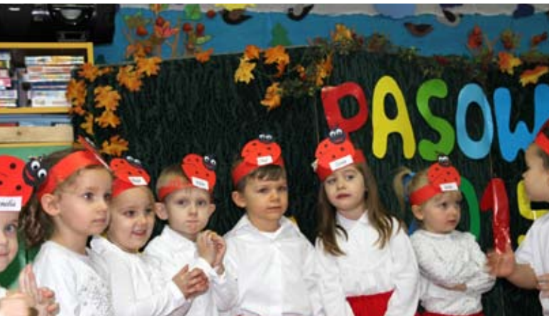
Przejęte „biedroneczki” z Samorządowego Przedszkola nr 2

Uroczystości zakończyły się wspólną zabawą z rodzicami i słodkim poczęstunkiem.