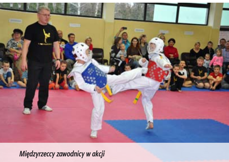
Międzyrzeccy zawodnicy w akcji

z sekcji taekwondo olimpijskiego. Niespodzianką była wizyta Mikołaja, który rozdał dzieciom prezenty – klubowe koszulki i ręczniki. To nie był koniec atrakcji. W nagrodę na wszystkich czekała czekoladowa fontanna i pizza.