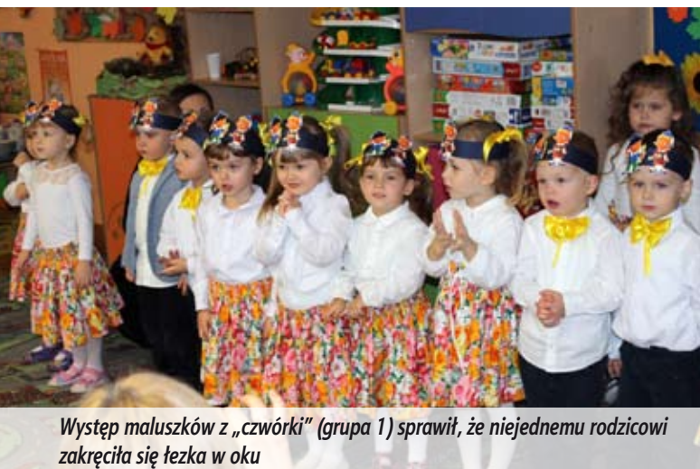
Występ maluszków z „czwórki” (grupa 1) sprawił, że niejednemu rodzicowi zakręciła się łezka w oku