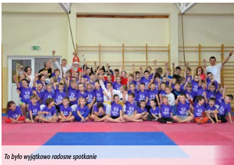
To było wyjątkowo radosne spotkanie