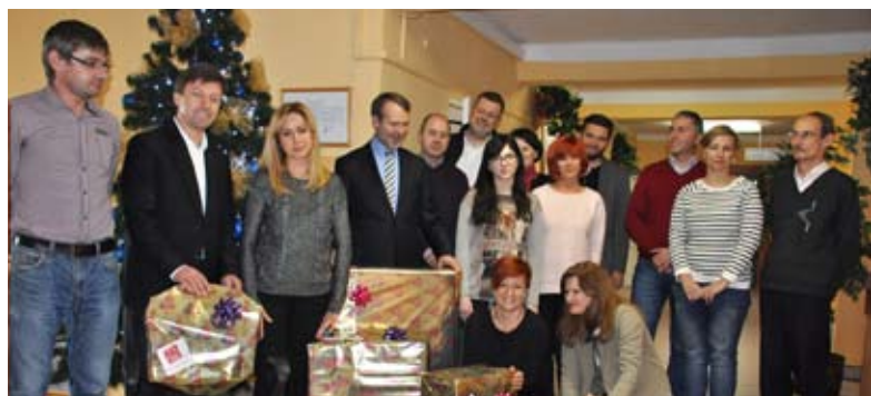
Pracownicy urzędu i podległych jednostek z radością przyłączyli się do Szlachetnej Paczki