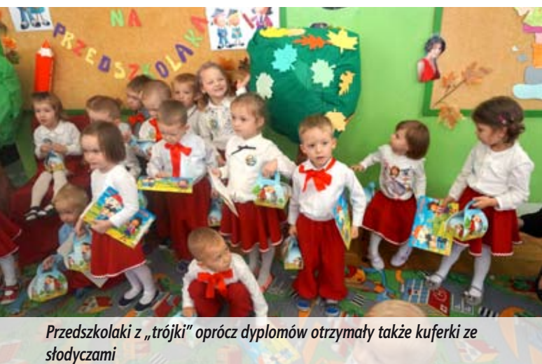
Przedszkolaki z „trójki” oprócz dyplomów otrzymały także kufereki ze słodyczkami