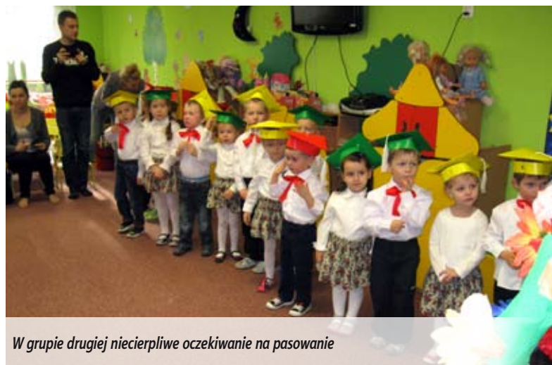
W grupie drugiej niecierpliwie oczekiwanie na pasowanie