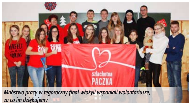
Mnóstwo pracy w tegoroczny finał włożyli wspaniali wolontariusze, za co im dziękujemy