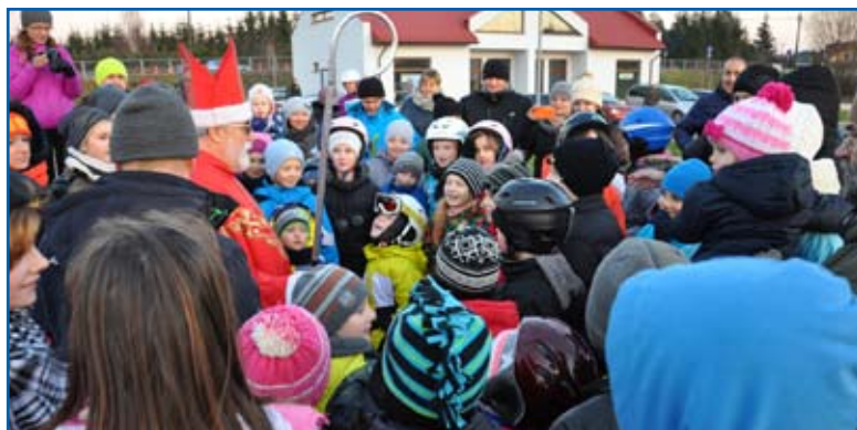
Każde dziecko otrzymało prezent od Mikołaja

Zajęcia narciarskie z instruktorem, ognisko z pieczeniem kiełbasek i prezenty od świętego Mikołaja. Takie atrakcje przygotował Miejski Ośrodek Sportu i Rekreacji wspólnie z grupą Aktywni Rowerowy Międzyrzec. Impreza odbyła się 5 grudnia przy stoku narciarskim. Nieco odważniejsi mieli okazję wejść do wody wspólnie z grupą bialskich i międzyrzeckich morsów. Najmłodszy z zapałem szusowali na stoku i nie miało znaczenia, że w ogóle nie było śniegu. Najwięcej emocji wzbudził Mikołaj, który słodkościami obdarował wszystkie dzieci.