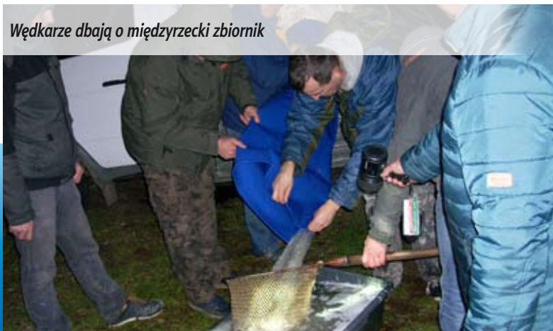
Wędkarze dbają o międzyrzeczki zbiornik

Międzyrzeczki „Żwirek” administruje ponad 40-hektarowym zbiornikiem na terenie Międzyrzeczkiej Jezioro od 9 lipca 2014 roku.