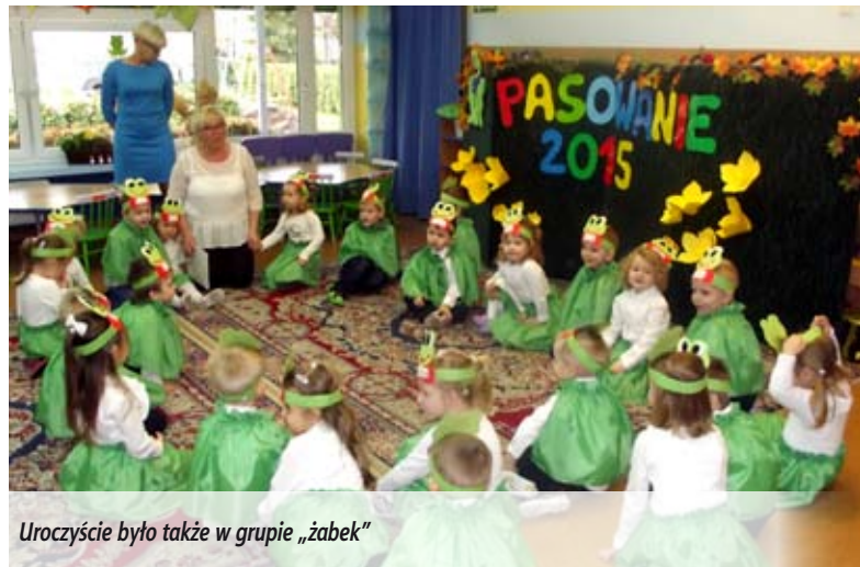
Uroczystość było także w grupie „żabek”