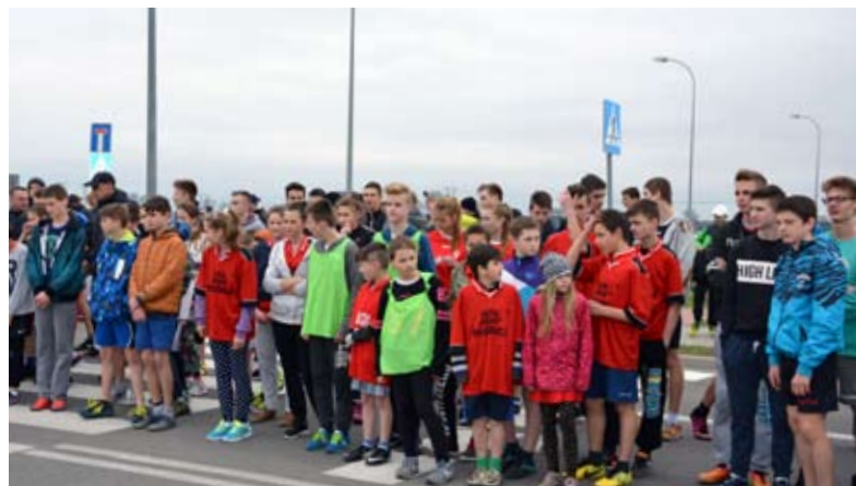
W zawodach wzięło udział 235 zawodników