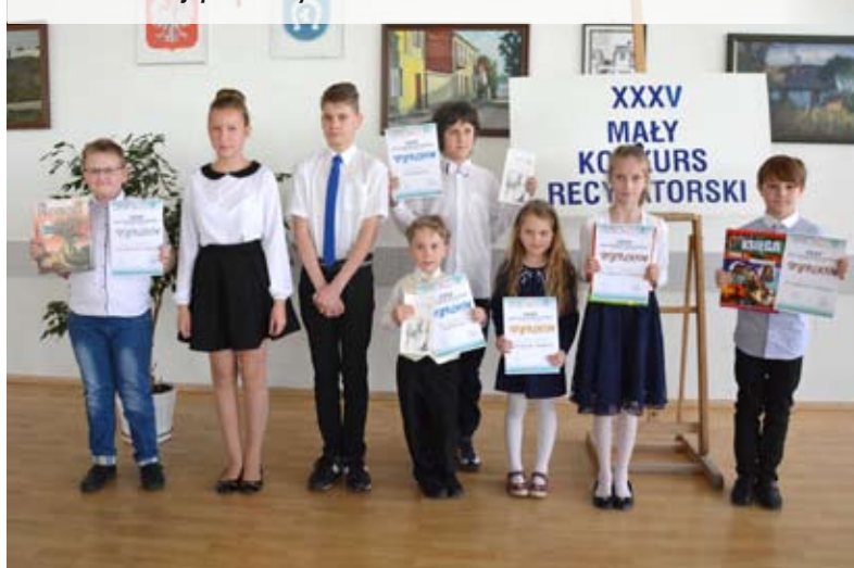
Laureaci eliminacji powiatowych

Zdobywcy pierwszego i drugiego miejsca pojedą na finał konkursu, który 2 i 3 czerwca odbędzie się w Lublinie.