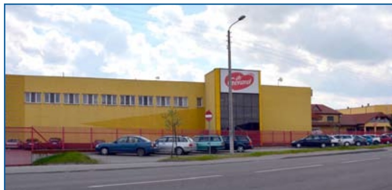
Już niedługo centrala firmy będzie znajdowała się w Międzyrzeczu

Zmiana siedziby spółki da olbrzymie możliwości miastu. – Udział w podatku CIT, a także PIT pracowników, do tego podatek od środków transportowych oraz od nieruchomości. Z szacunków wynika, że do budżetu może