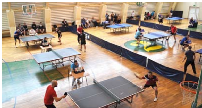
Memoriał na stałe wpisał się kalendarz międzyrzeckich imprez