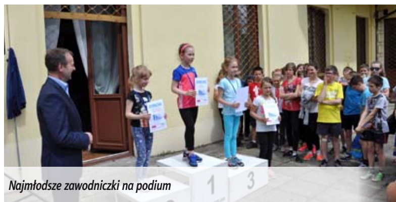
Najmłodsze zawodniczki na podium