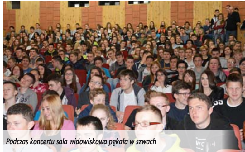
Podczas koncertu sala widowiskowa pękała w szwach