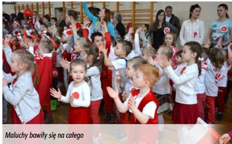
Maluchy bawiły się na całego