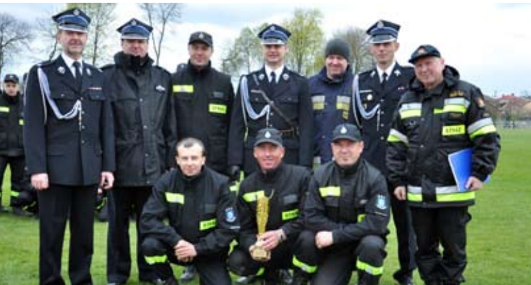
Reprezentacja OSP Śródmieście

Odbyły się one 24 kwietnia na stadionie w Międzyrzecu Podlaskim. Wystartowało w nich 25 drużyn męskich i 5 żeńskich. Zawodnicy mieli do