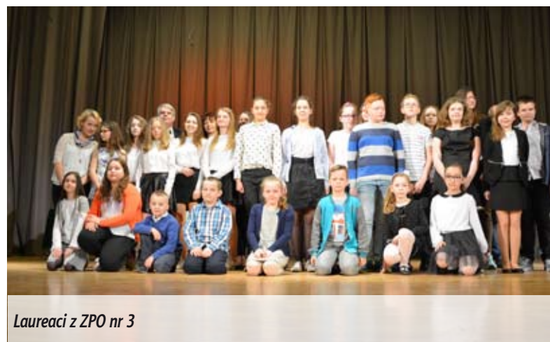
Laureaci z ZPO nr 3