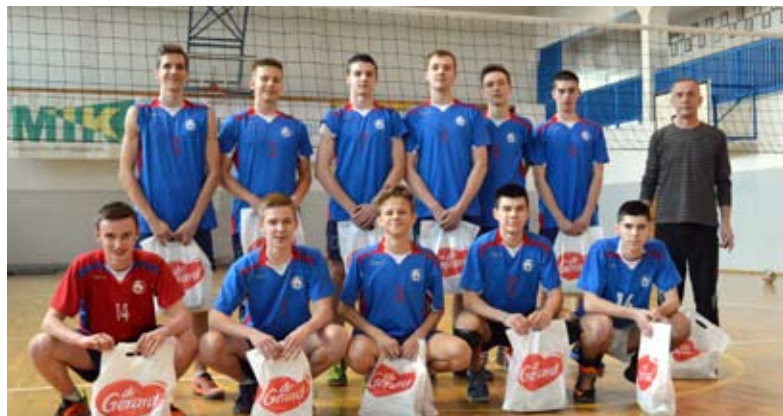
Międzyrzeczka reprezentacja w komplecie