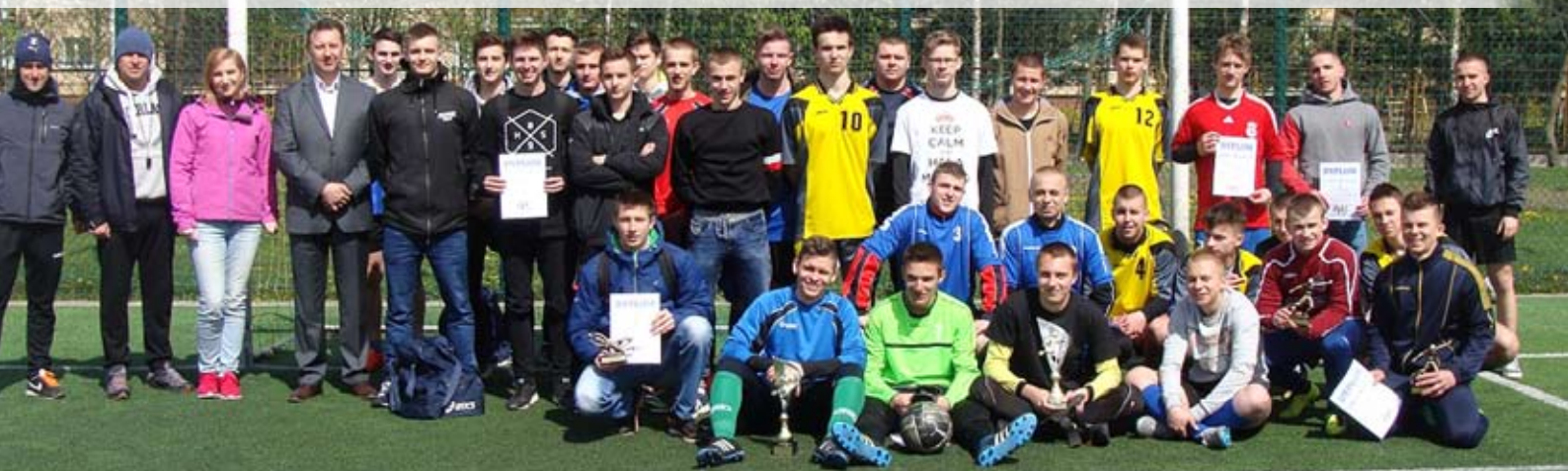
W turnieju wzięło udział 6 drużyn