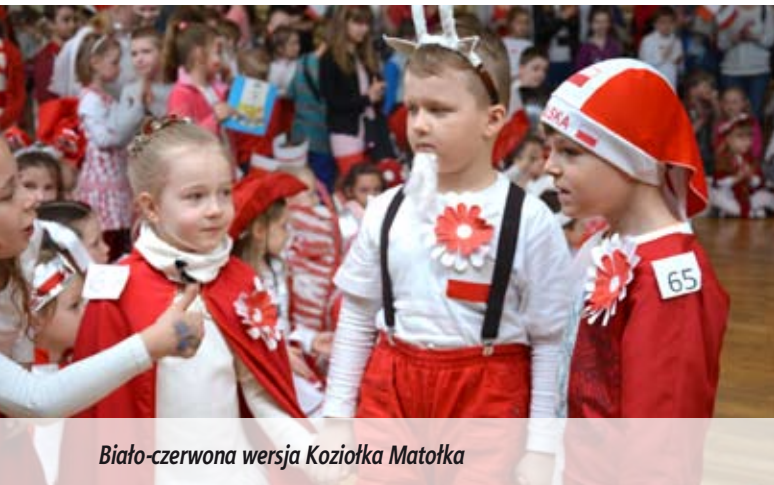
Biało-czerwona wersja Koziołka Matołka