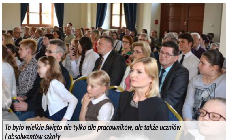
To było wielkie święto nie tylko dla pracowników, ale także uczniów i absolwentów szkoły