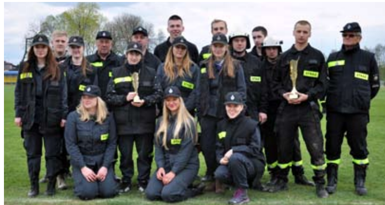
Z OSP Zawadki wystartowały dwie drużyny